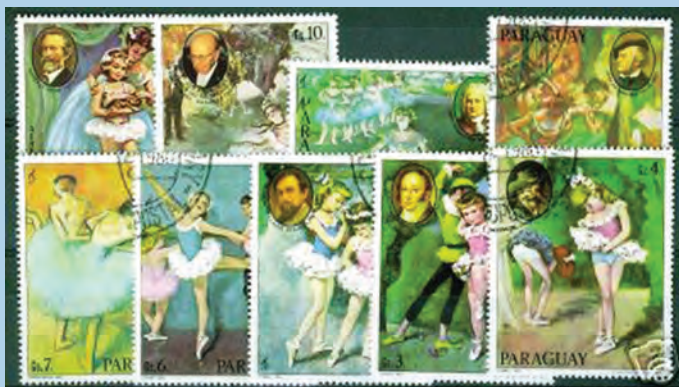
Paragvajski niz od 9 maraka na temu Glazba na poštanskim markama iz 1980. godine.

Prvo, izdanje je neobično već po tome što se skladatelje, kao što su Beethoven, Wagner ili Bach, dovodi u vezu s baletnim temama, što je, kažu stručnjaci, vrlo netipično. Zatim, ispod lika njemačkog