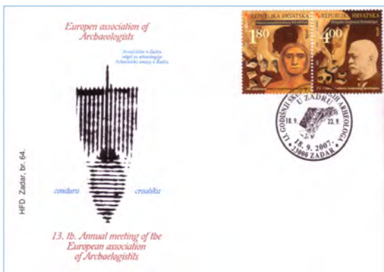
Prigodna omotnica br 64. 18.9.2007. 23000 Zadar