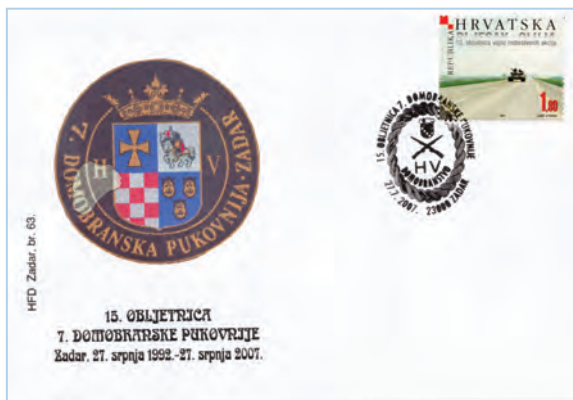
Prigodna omotnica br 63. 27.7.2007. 23000 Zadar