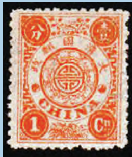
Kineska "Wu Fu" marka sa (stiliziranim) prikazom pet šišmiša u krugu iz 1894. godine

tiskano s pogreškom, jer se umjesto pet šišmiša vide samo četiri , pa se primjerak te marke danas može naći na filatelističkom tržištu po cijeni od čak 68.000 US dolara .