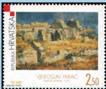
Hrvatsko moderno slikarstvo VII. Izdanje 2001.

Hrvatska pošta je 1. prosinca 2001. godine izdala prigodni niz od 3 marke Hrvatska moderno slikarstvo . Na marki od 2,50 kn prikazana je reprodukcija slike našeg poznatog likovnog umjetnika