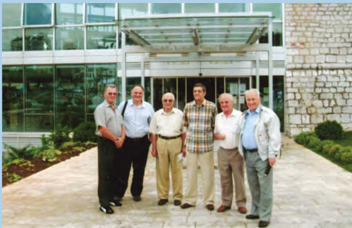
Fotografija za uspomenu