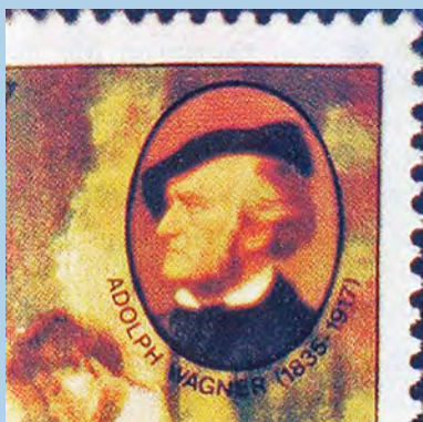
Pogrešni podatci ispod slike Richarda Wagnera

skladatelja Richarda Wagnera piše: Adolph Wagner 1835. - 1917. Točan podatak bio bi: Richard Wagner 1813. - 1883. Naime, godine 1835. - 1917. odnose se na njemačkog ekonomista Adolpha Wagnera.