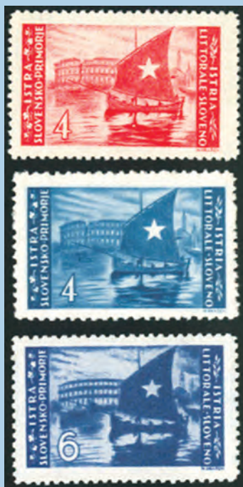
Izdanja za Zonu B (pod jugoslavenskom vojnom upravom) iz 1945 i 1946.

Prva marka koja je bila u uporabi na području današnjeg teritorija Republike Hrvatske, a koja je prikazivala amfiteatar