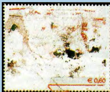
Marka 100 godina auto trke Fargo Florio prije i nakon namakanja u mlakoj vodi