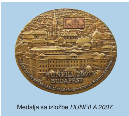
Medalja sa izložbe HUNFILA 2007.

Naš časopis Zadarski filatelista je u izložbenom razredu filatelističke literature osvojio srebrno brončanu medalju (63 boda).