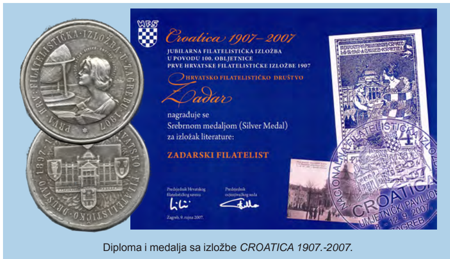
Diploma i medalja sa izložbe CROATICA 1907.-2007.

Međutim, želim ukazati na svojevrstan paradoks sa ove izložbe. Naime, na tri inozemne filatelističke izložbe naš časopis je jednom bio ocijenjen sa 63 boda i dva puta sa 65 bodova. Na nacionalnoj izložbi je ocijenjen sa 65 bodova, čime se vidi kontinuitet i slično razmišljanje naših sudaca s inozemnima. Međutim upada u oko činjenica da je sa tih 65 bodova naš časopis bio predzadnji izložak u klasi filatelističke literature. Neki hrvatski izložci u klasi filatelističke literature, koji su na spomenutim inozemnim filatelističkim izložbama, bili ocijenjeni i sa 5 bodova manje od našeg časopisa na nacionalnoj su izložbi sada imali gotovo 5 bodova više. Bit ću toliko kulturna pa neću ništa prejudicirati, ali mislim da je, uz Hrvatsku filateliju , Zadarski filatelista najbolji hrvatski filatelistički časopis, a ujedno i najbolji društveni filatelistički časopis.