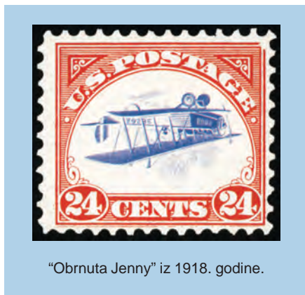
"Obrnuta Jenny" iz 1918. godine.