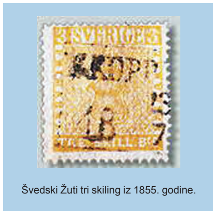
Švedski Žuti tri skilling iz 1855. godine.

madu. Nakon što su marke nekoliko puta promijenile vlasnika, Sigmund Friedl ih je prodao 1894. Philippu von Ferrariyu, vlasniku tada najveće zbirke na svijetu, koji je platio nevjerojatnih 4.000 guldena. Kako je vrijeme prolazilo, a nije se pojavljivalo još "žutih" maraka te vrijednosti, postalo je jasno da je ta marka ne samo rijetka nego je možda i jedini saču-