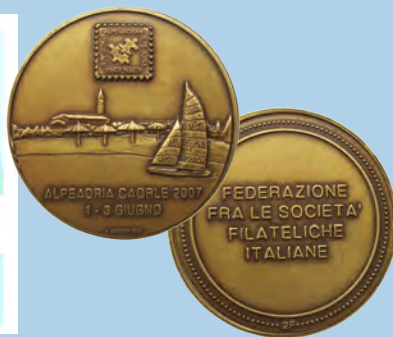
Diploma i medalja sa izložbe APLEADRIA 2007.