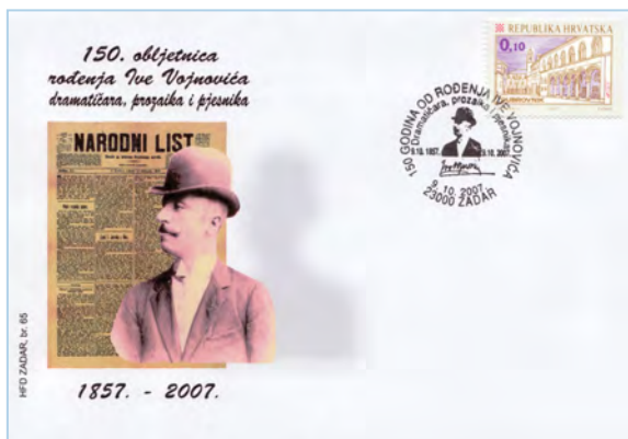
Prigodna omotnica br 65. 9.10.2007. 23000 Zadar