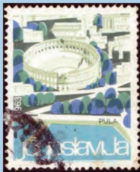
Prigodno izdanje SFRJ iz 1963. s motivom na kojem je prikazana arena u Puli

bila prepoznata važnost tog kulturnog-povijesnog fenomena, da se njezina znamenitost i ljepota objelodani i šire diljem