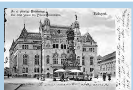
Dom mađarske kulture u starom dijelu Budima u kojoj je održana izložba HUNFILA 2007.

dimpešti u čast 85. godišnjice MABEO-SZ – a i 140. obljetnice Mađarske pošte, a pod pokroviteljstvom FEPA (Federation of European Philatelic Association) i uz pomoć Mađarske pošte.