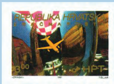
Zračna pošta Zagreb - Pula, izdanje 1991.

Marka je tiskana prema nacrtu Đ. Gorbunova u offset tisku u štampariji ZIN u Beogradu. Prodajni arak sadržava 50 maraka (5 X 10), zupčanje češljasto