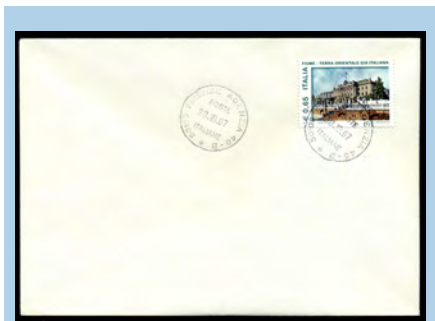
Omotnica s markom od 65 centi i žigom

i veliki broj raznovrsnih koverti i pisma s ovom markom (datirana 30. listopada i kasnije). Ta pisma su, poštanski gledano, nelegalna i predstavljaju falsifikate na štetu filatelista. Međutim, kako je na marki sporan tekst postoji stanovita bojazan da bi Poste Italiane mogle izdati istu marku, ali s izmijenjenim tekstom, čime bi ova marka zadržala visoku cijenu.