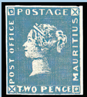
"Post Office" Mauricijus od 1 i 2 penija iz 1847. godine

pogrešnog teksta došlo je zato jer je čovjek koji je radio marku, Joseph Barnard, bio star i zaboravljiv. Na putu u tiskaru prošao je pored poštanskog ureda s natpisom "Post Office" i malo kasnije zabu-