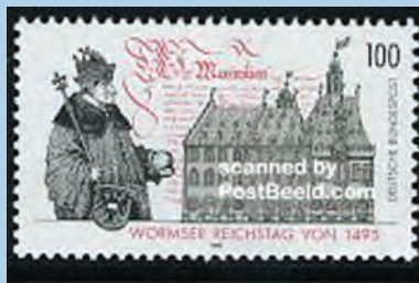
Umjesto Cara Maximilijana I. na marki je prikazan lik Cara Friedricha III.

Zaključno, oprez kod čišćenja tavana, starih škrinja i kutija, jer, nikad se ne zna !